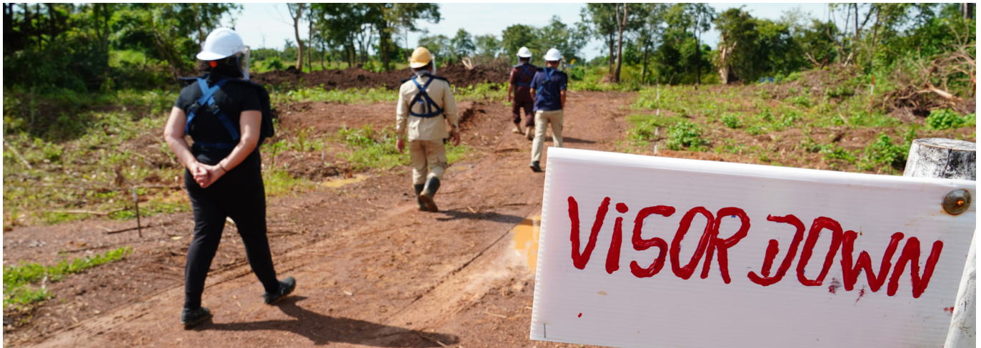
La participation pleine des femmes aux opérations de dépollution rend l'action contre les mines plus efficace et mieux adaptée. Visite du GICHD au Cambodge, 2022